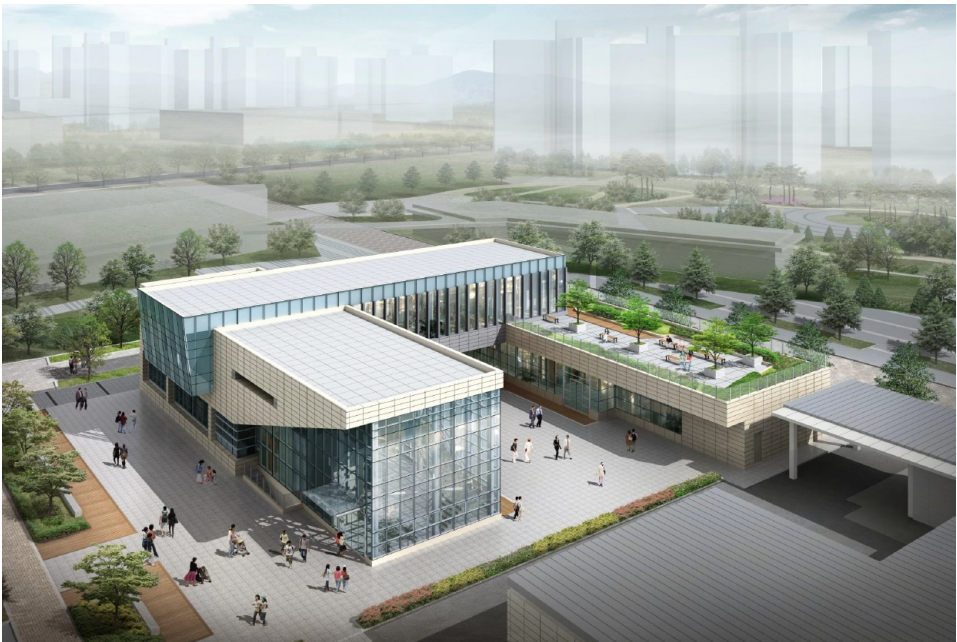
[그림 3-3] 싱싱문화관 조감도