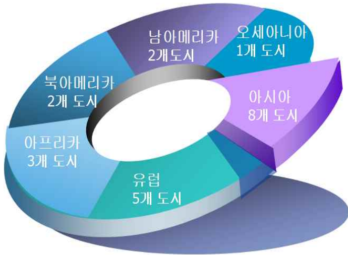
[그림 3] 지역별 교류 현황