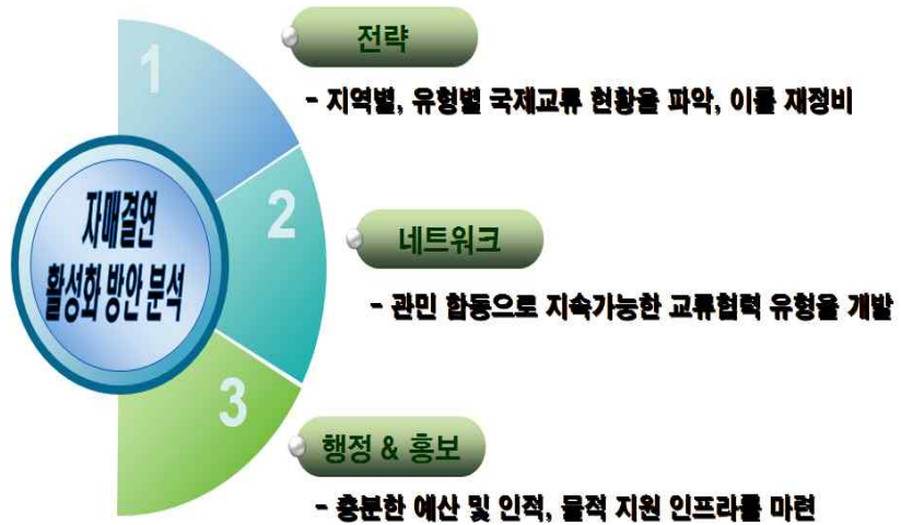
[그림 1] 국제교류 활성화 방안 분석틀