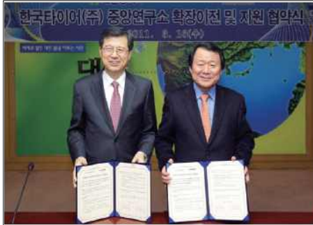
지난 3월 16일 한국타이어(주)는 죽동지구에 중앙연구소를 확장·건립하기로 업무협약을 체결했다.

▷ 민선 5기 1년, 기업 202개 1조 6천 603억원 유치, 11,149명의 고용 창출 효과를 거둬. 한국타이어(주)와 「중앙연구소 확장 건립 및 지원협약」 체결하는 등 많은 성과가 있었음. 그 결과, 52개 기업에 대해서 산업용지 분양을 마무리함