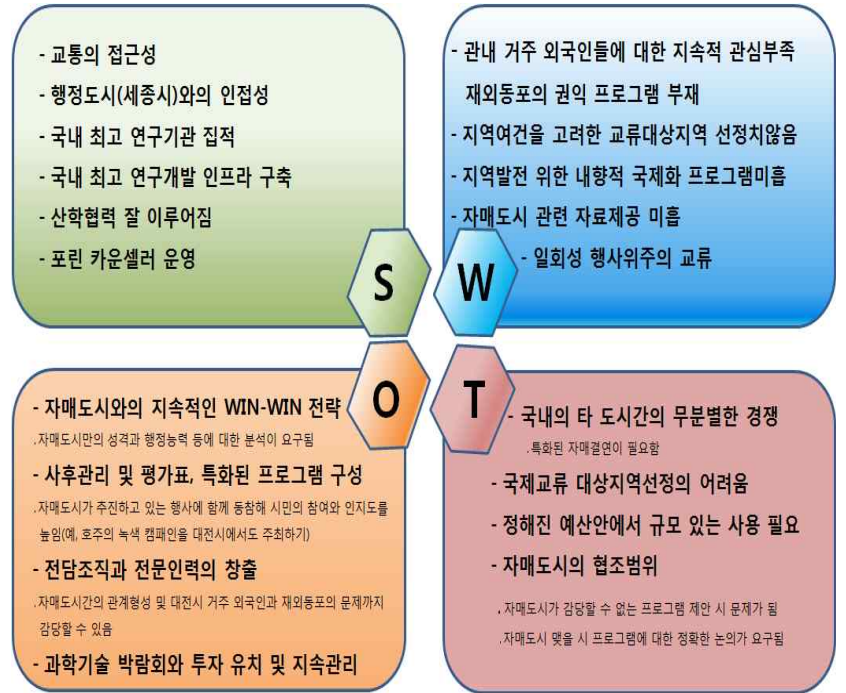
[그림 5] 대전 시 자매결연 활성화 방안을 위한 SWOT 분석