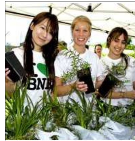
▷ 호주 브리즈번시에서는 2011년 4월 3일, 10일 시민들이 생활비를 줄일 수 있도록 주거환경에 대한 무료 녹색생활캠페인을 실시. 행사를 통해 홍수 피해 이후 주택과 정원을 재정비하고자 하는 시민들에게 유용한 정보를 줄 것으로 예상. 4가지의 자생화 세트(블루 플렉스 백합, 메트 러시, 쇠뜨기, 티트리)를 제공.