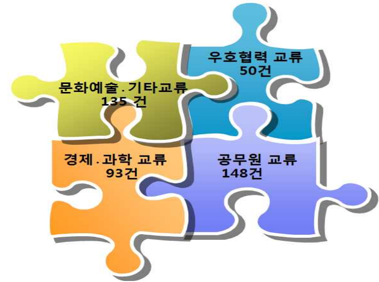
[그림 2] 유형별 교류 현황