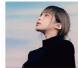
헤이즈 | Heize

대전엑스포 30주년 및 대전 국제 와인 EXPO 축하공연 (9월 10일)