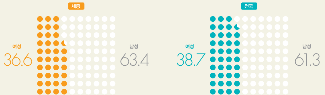
5급 이상 지방자치단체 공무원 비율(2017)