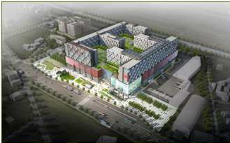
유성 광역복합환승센터 개발사업