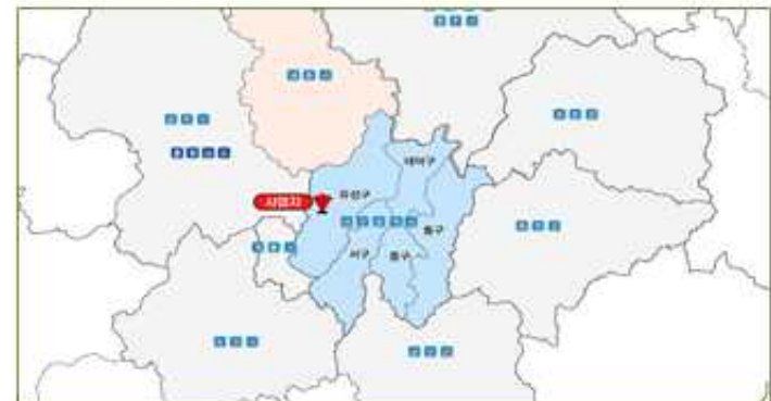
유성 광역복합환승센터 개발사업