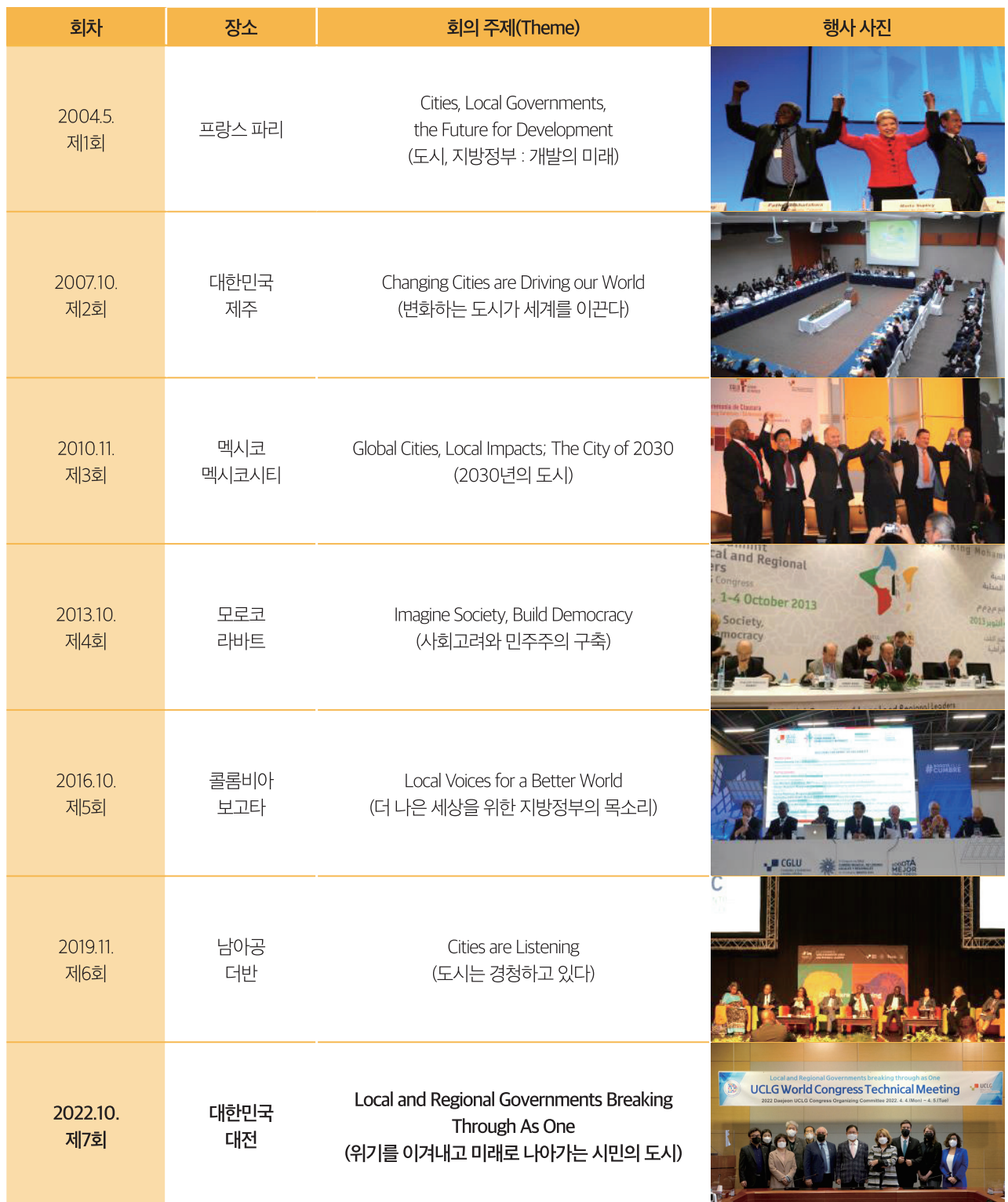
UCLG 세계총회(1~7회) 주제 및 행사 사진